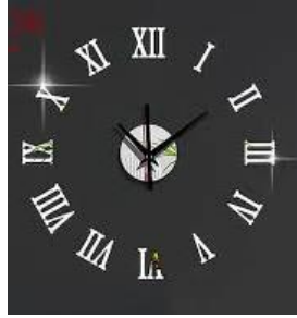
Kurejea Kwa Mfalme Mwisho wa Wakati